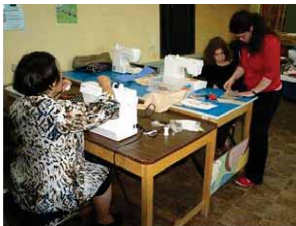
Tableau 6 : Activités offertes aux adultes et familles