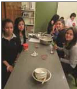
Table de jeunes

C'est à raison d'une fois aux deux semaines que les jeunes se réunissent dans la cuisine du Centre Lajeunesse, afin de cuisiner des repas facile à faire. Ces ateliers sont très attendus auprès des jeunes, autant des gars que des filles. Lors de ces ateliers, nous cuisinons entre autre de la pizza, des salades, des smoothies, des grignotines et des sandwiches. C'est entre 10 et 15 jeunes qui mangent ensemble une semaine sur deux.